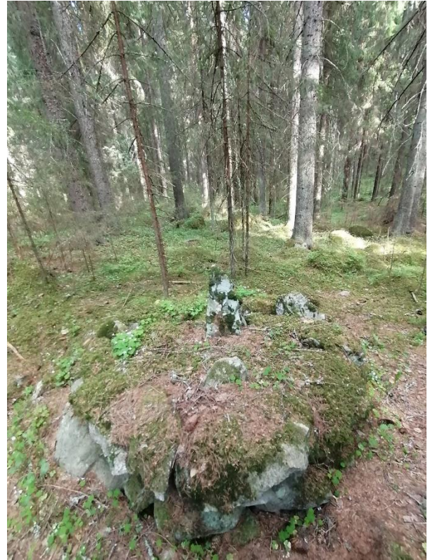
Vanha rajakivi vuodelta 1442, jolloin Myllykselä ja Joenniemi erotettiin Iso-Äiniön kylästä. Rajariita käytiin vuonna 1745.