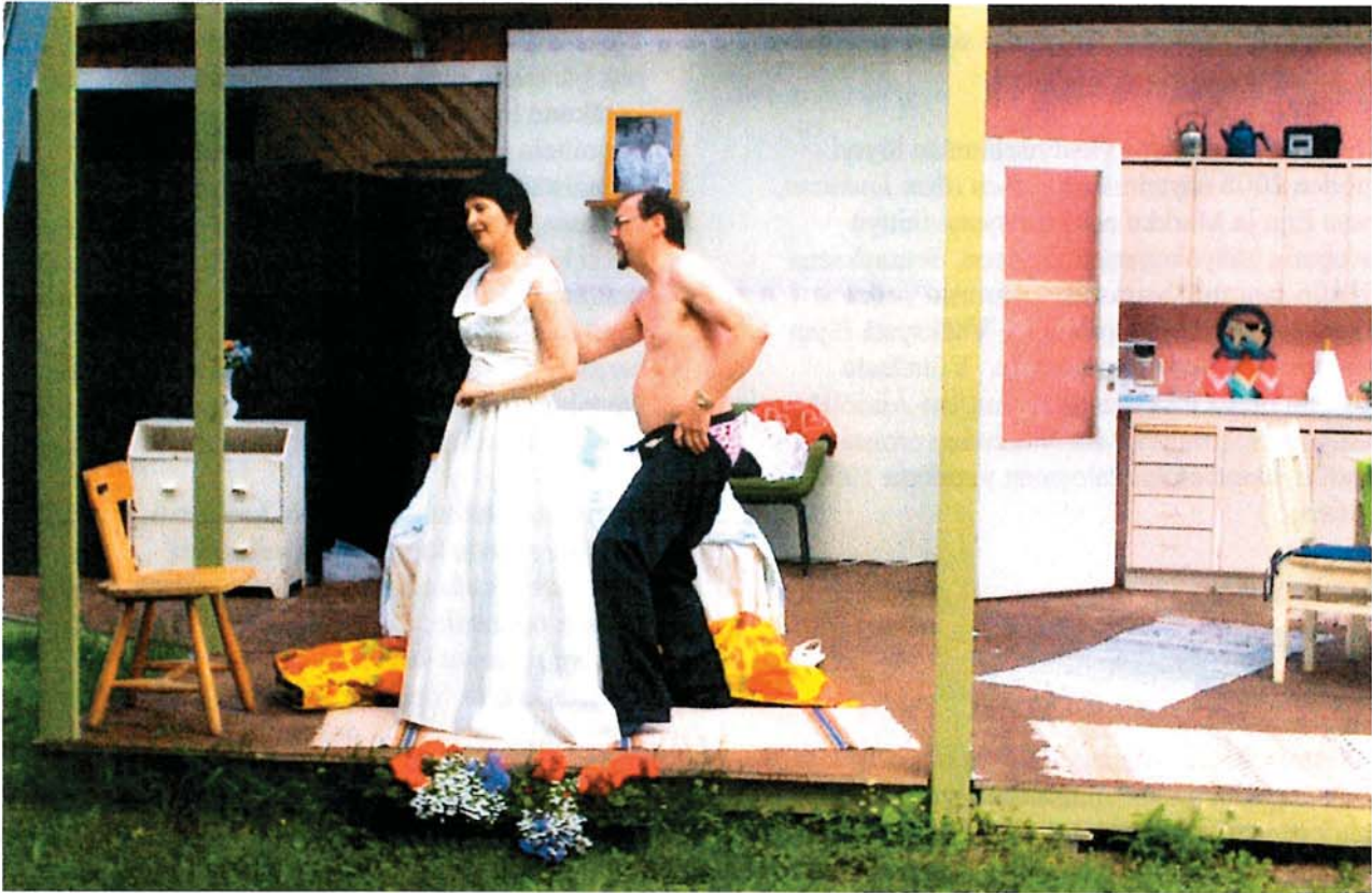
Kahen akan loukussa -näytelmässä 2008 vastaviihityt aloittelemassa hääyötä: morsiamen puvun vetoketju jumissa, sulhasen housut hermostuksesta putoamassa ja anoppi tulossa pilaamaan loputkin.