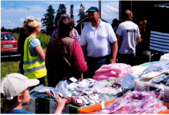
Kylämarkkinat veti tällä kertaa ennätysmäärän väkeä myyntipöytien ympärille.