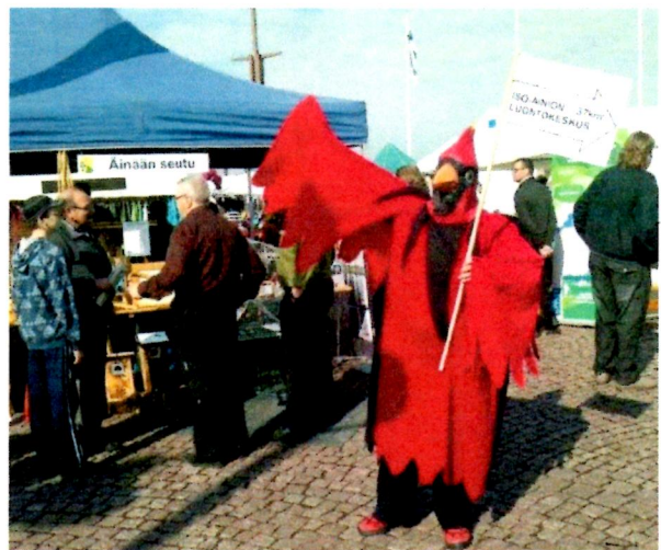
Lintumme vauhdikkaissa mainospuuhissa.