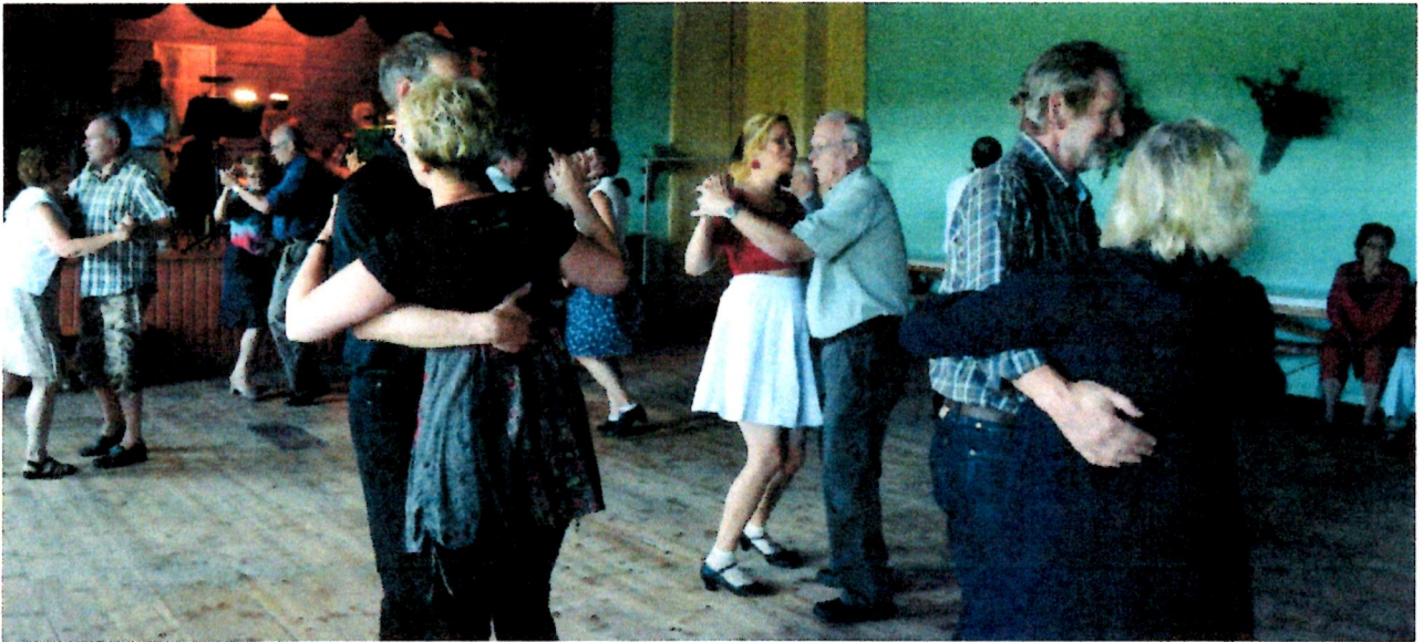
Jalalla pantiin todella koreasti seurantalons parketilla Hassakoivun pelimannien tahdissa.