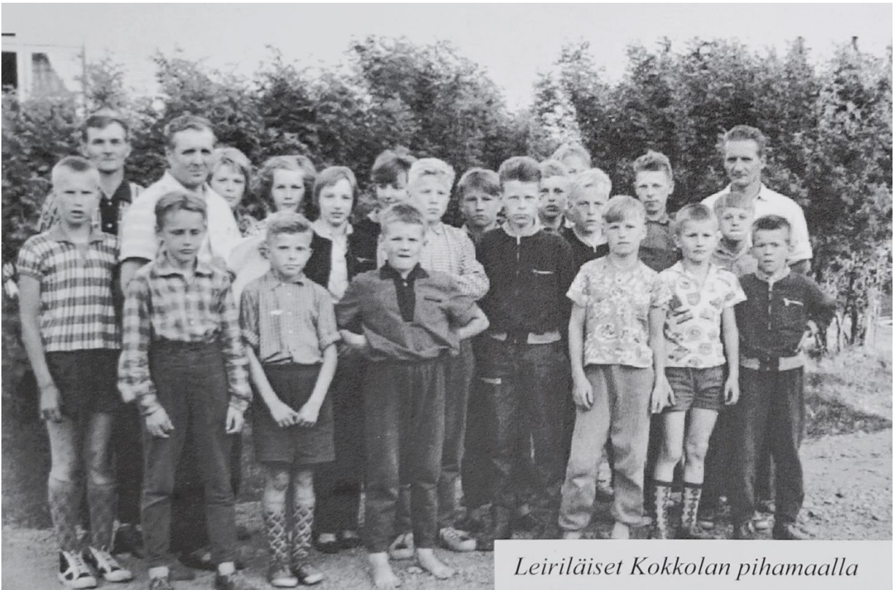
Suunnistajia Iso-Äiniöllä kolmepäiväisellä leirillä Kokkolassa vuonna 1961. Kuva on lainattu kirjasta: Asikkalan Raikas; Suunnistuksen historiikki 1949–2000, kappaleesta: Kalle Tommo; Suunnistajien nuorten leirit vuosina 1955–61.